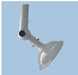
Absaughaube mit Gelenk.

Lötrauchabsaugung, Laborarbeiten, Gold- bzw. Silberschmieden, Friseur- bzw. Beauty-Salon, Schweißrauch beim WIG-Schweißen und viele weitere Anwendungen