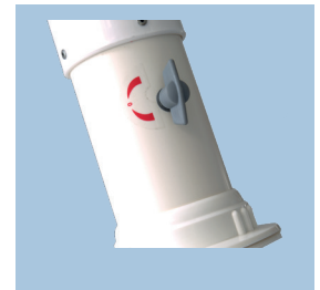
Drehregler für Absperrklappe